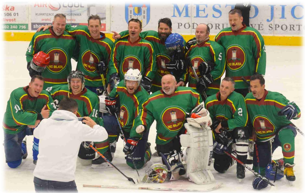
HC BLATA xxxx – 3. místo