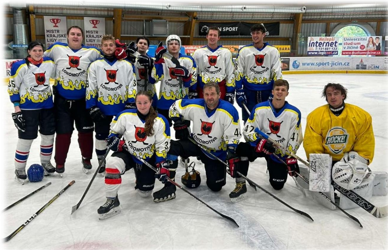
Tým HC Položeny Pardubice, jenž skončil na 4. místě.